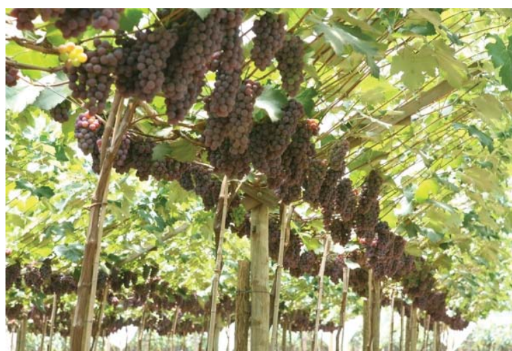
Parreiras, prato pronto e a Festa da Uva de Louveira começa dia 30 de novembro

Endereço: Rod. Romildo Prado, km 6 - Bairro Abadia. Horá-