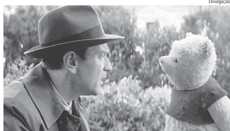
Christopher Robin cine nos bairros

aventuras ao lado do Ursinho Pooh e outros adoráveis animais no Bosque dos 100 Acres. Porém, chegada a hora, Christopher tem que se despedir dos seus amigos e adentrar ao mundo dos adultos. Ele se torna um homem de negócios e pai de família com grandes responsabilidades, mas perde o rumo de sua vida. Um dia, os seus amigos de infância resolvem visitá-lo no mundo real e o ajudam a lembrar que aquele amável e divertido menino ainda existe em algum lugar. Informações: 3436-0466.