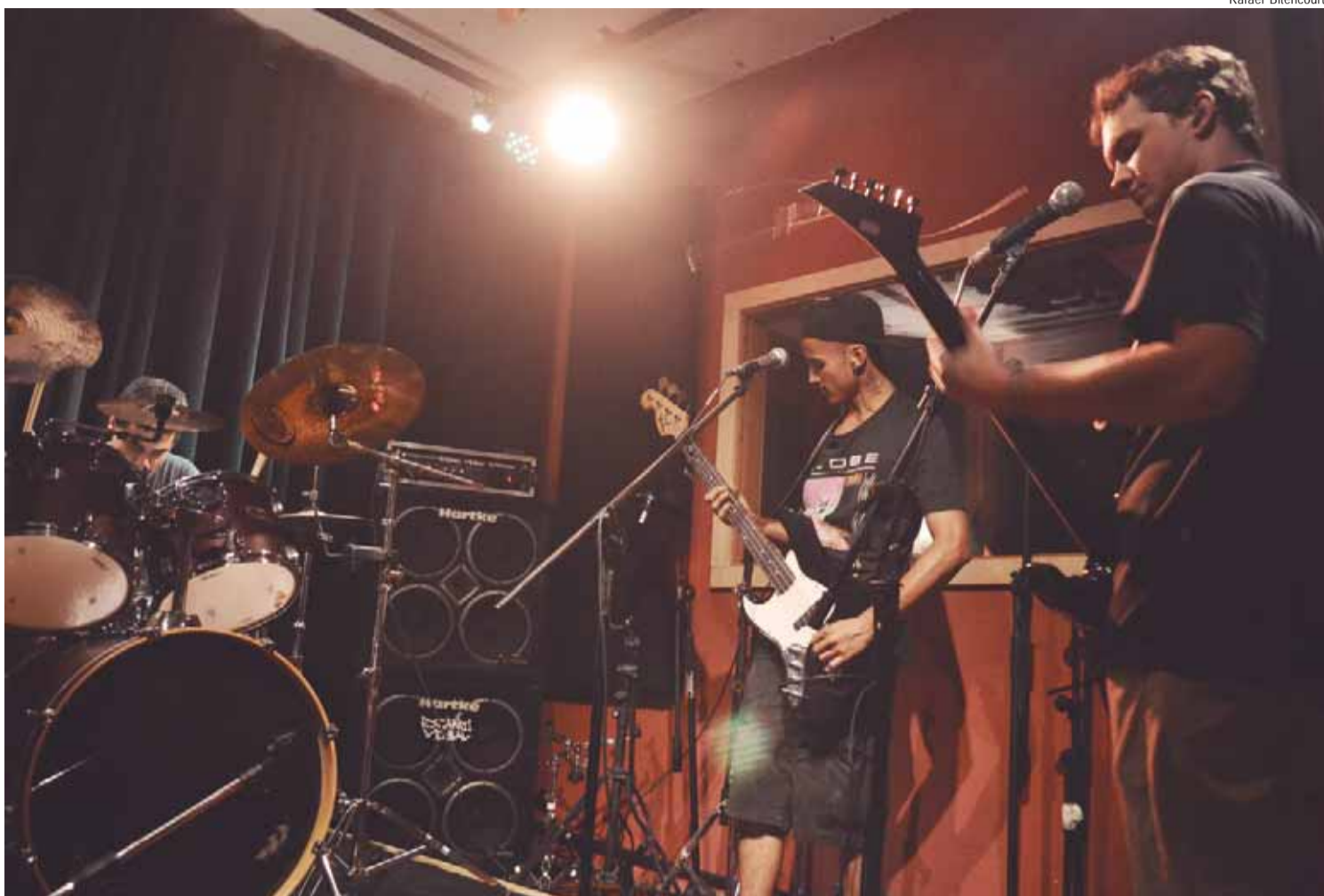
Processo de gravação acontece no Casarão Music Studio

A banda piracicabana de metal STAB está em processo de gravação de seu novo EP, que contará com quatro faixas e um bônus. Intitulado Sepulchral Lullaby, o material terá as canções The Window, In the streets of the town, Scum e Gods Sheep, além de The end (já gravada anteriormente, em formato "ao vivo no estúdio"). A previsão é que o material seja lançado entre o final deste ano e início de 2020.