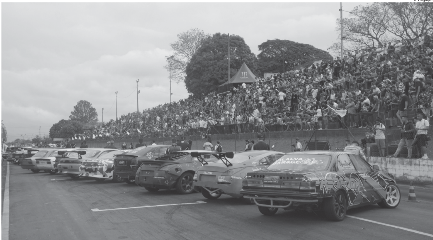
Competição será na pista do Esporte Clube Piracicabano de Automobilismo

Primeira edição do evento acontece no próximo sábado (7) e no domingo (8), no ECPA, para coroar campeão paulista da modalidade