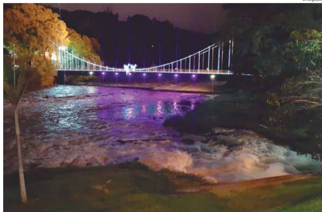
Iluminação especial faz parte do projeto natalino Luz & Arte

O Elevador Turístico também recebeu 80 mil leds em formato de cascata e cinco estrelas luminosas fixas no mirante e ficará aberto para visitação, às sextas-feiras, das 17 às 21h; sábados, domingos e feriados, das 13 às 21h, incluindo os feriados de 25 de dezembro e 1º janeiro. A programação segue até o dia 5 de janeiro. "Agradecemos a parceria de todos os envolvidos, especialmente os patrocinadores da iluminação. O elevador turístico recebe, durante a programação especial de natal, mais de 12 mil visitantes e apesar de ser um dos pontos turísticos mais visitados na cidade, acreditamos que a iluminação atrai ainda mais pessoas", comen-