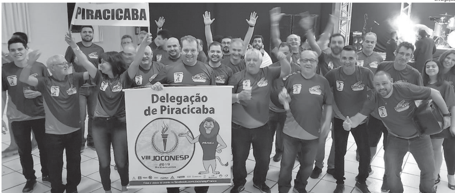
VIII Jaconesp aconteceu em Franca, nesse fim de semana

O Sincop (Sindicato dos Contabilistas de Piracicaba e Região) conquistou o 6º título dos VIII Jaconesp (Jogos Abertos dos Contabilistas do Estado de São Paulo), na cidade de Franca, nesse fim de semana. O 2º lugar dos Jogos ficou com a equipe da cidade de São Paulo e em terceiro, Campinas. A competição reuniu 20 delegações e mais de 400 atletas. Cerca de 30 atletas associados forma-