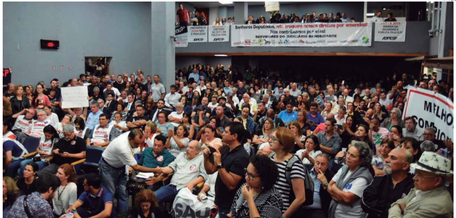
Ontem (2), servidores estaduais lotaram o auditório da Alesp, para dizer não à aprovação das propostas do Governo

Paralisação, que acontece hoje, também tem como alvo a "nova carreira" para o magistério, que é projeto do governador João Dória (PSDB)