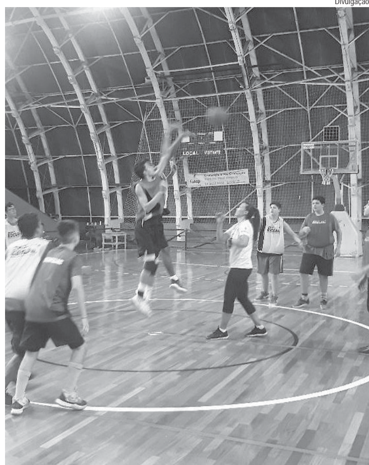
Crianças e adolescentes, dos 7 aos 17 anos, participam do evento

Cerca de 200 alunos que frequentam as aulas regulares do PDB (Projeto Desporto de Base) participaram no final de semana dos festivais esportivos realizados pela Prefeitura de Piracicaba, por meio da Selam (Secretaria Municipal de Esportes, Lazer e Atividades Motoras). As atividades têm o objetivo de promover a prática e o desenvolvimento esportivo para crianças e adolescentes do município, na faixa etária dos 7 aos 17 anos.