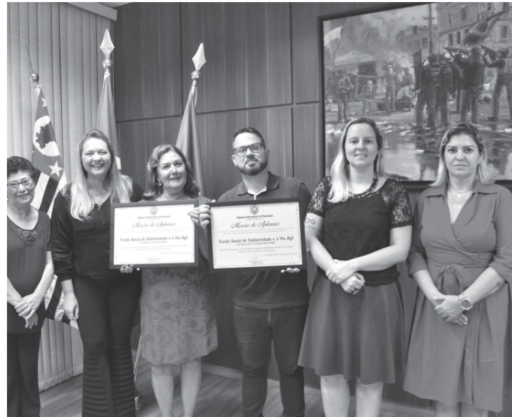
Moção de aplauso foi entregue na noite dessa quinta (5)

Essa foi a segunda moção de aplauso da empresa em 2019. A primeira aconteceu em julho, quando a Campanha "A Culpa é sua", em parceria com a Semutran (Secretaria Municipal de Trânsito e Transportes), também ganhou reconhecimento da casa legislativa municipal.