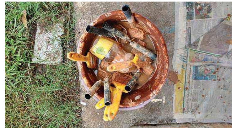
Oficina acontece neste sábado (7), das 14h30 às 16h30