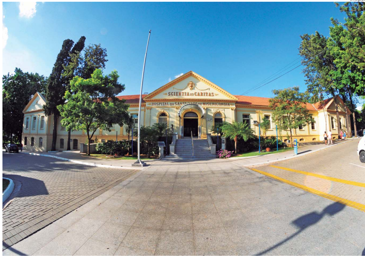
Santa Casa de Piracicaba foi fundada pelo comerciante português, José Pinto de Almeida

Entidade de Piracicaba, fundada em 25 de dezembro de 1854, é hoje uma das mais importantes instituições filantrópicas do País; solenidade começa a partir das 9h