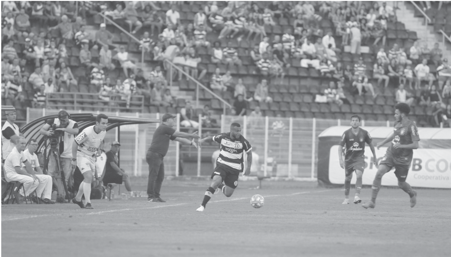
Elenco do XV de Piracicaba segue em ritmo de preparação

O XV de Piracicaba conheceu, na tarde de ontem (12), após sorteio realizado na sede da CBF (Confederação Brasileira de Futebol), no Rio de Janeiro, o seu adversário na primeira fase da Copa do Brasil 2020, competição que não disputa desde 1991. O Nhô Quim irá encarar o Londrina, em jogo único que acontecerá no estádio Barão da Serra Negra, em Piracicaba, no dia 5 ou no dia 12 de fevereiro, o que ainda será confirmado pela CBF, assim como o horário da partida.