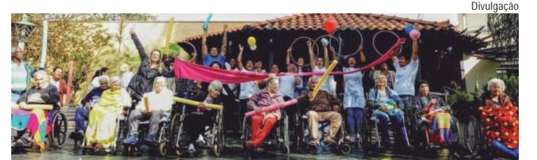
Pacientes poderão assistir uma cantata de Natal, neste sábado

Neste mês de dezembro, o HRP (Hospital Regional de Piracicaba) promove diversas ações para fortalecer o espírito natalino entre os pacientes e os colaboradores. A comissão de Humanização da unidade iniciou uma campanha de arrecadação de produtos de higiene pessoal como fraldas ou papel higiênico ou um kit de banho para os moradores do Lar Betel. Além da arrecadação, os pacientes internados na unidade poderão assistir uma cantata de Natal, neste sábado (14), às 16h, realizada pela Igreja Presbiteriana do bairro Piracicamirim. No dia 17, a direção do HRP inaugura o espaço ecumênico do hospital (capela), às 9h, com o primeiro culto ministrado por um padre e um pastor.