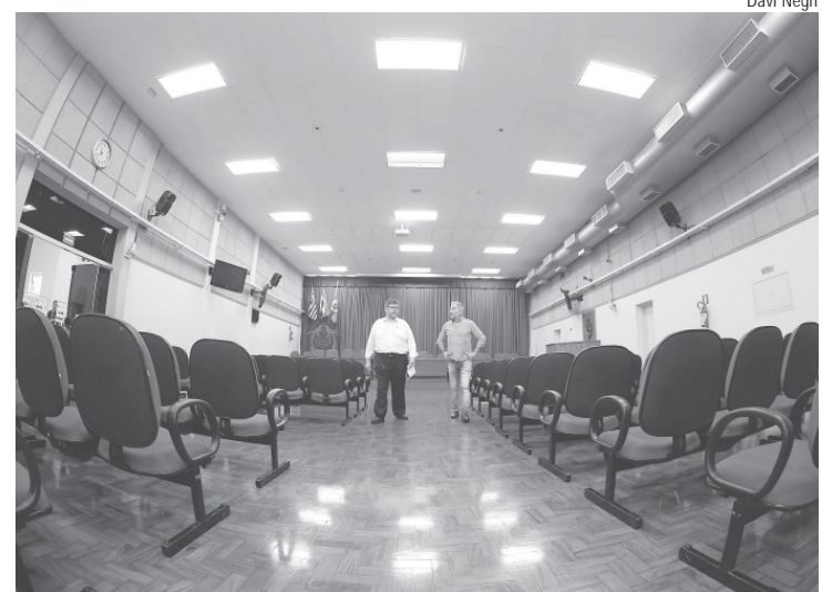
A última reforma do Salão Nobre ocorreu em 2002

A Câmara pretende que os painéis utilizados para a finalidade possuam alta resistência mecânica e elevado coeficiente de absorção sonora, a exemplo dos que são aplicados em teatros, auditórios e cinemas. A empresa responsável pela obra deverá aplicar no salão nobre materiais