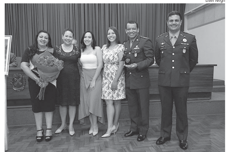
Solenidade de desativação aconteceu no último dia 5, na Câmara

Também chamou atenção para a nova concepção de agrupamentos, onde o Exército ficará em novos postos de observação, o que também poderá envolver a cidade