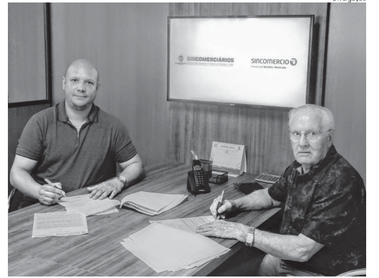
Sincomerciários e Sincomércio assinaram a convenção

O Sincomércio Piracicaba (Sindicato do Comércio Varejista) e o Sincomerciários (Sindicato dos Empregados no Comércio de Piracicaba) assinaram a CCT (Convenção Coletiva de Trabalho) que garante um reajuste de 4,5% no salário dos comerciários da cidade, de dezembro de 2020, das 12h às 15h; dia 2 de janeiro de 2020, das 12h às 18h; Carnaval 2020, na segunda (24 de fevereiro), aberto em horário normal, na terça (25 de fevereiro), fechado; na quarta (26 de fevereiro), aberto a partir das 12h.