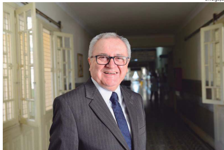
Pavão é membro da Mesa Diretora da Santa Casa desde 1996

Segundo o provedor, o apoio que a Santa Casa tem recebido da