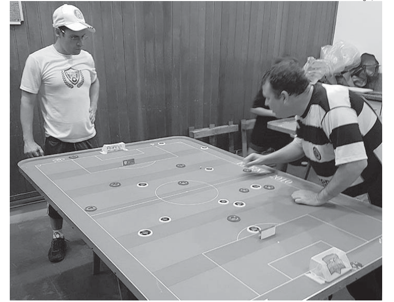
Torneio de Futebol de Mesa aconteceu nos últimos dias 10 e 12

O futebol de mesa em Piracicaba vem ganhando cada vez mais simpatizantes e praticantes. Em 2019, a Prefeitura de Piracicaba, por meio da Selam (Secretaria Municipal de Esportes, Lazer e Atividades Motoras), cedeu um espaço para treinamentos, clínicas e realização de torneios para Associação Piracicabana de Futebol de Mesa.